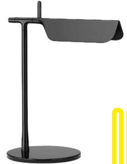
Arriba: FLOS Versión LED de la lámpara Tab diseñada por Barber & Osgerby con la pantalla en forma de un libro medio abierto. <www.flos.com> Abajo: POLIFORM Sofá individual de grandes dimensiones Big Bug, diseño de Paola Navone. <www.poliform.it>