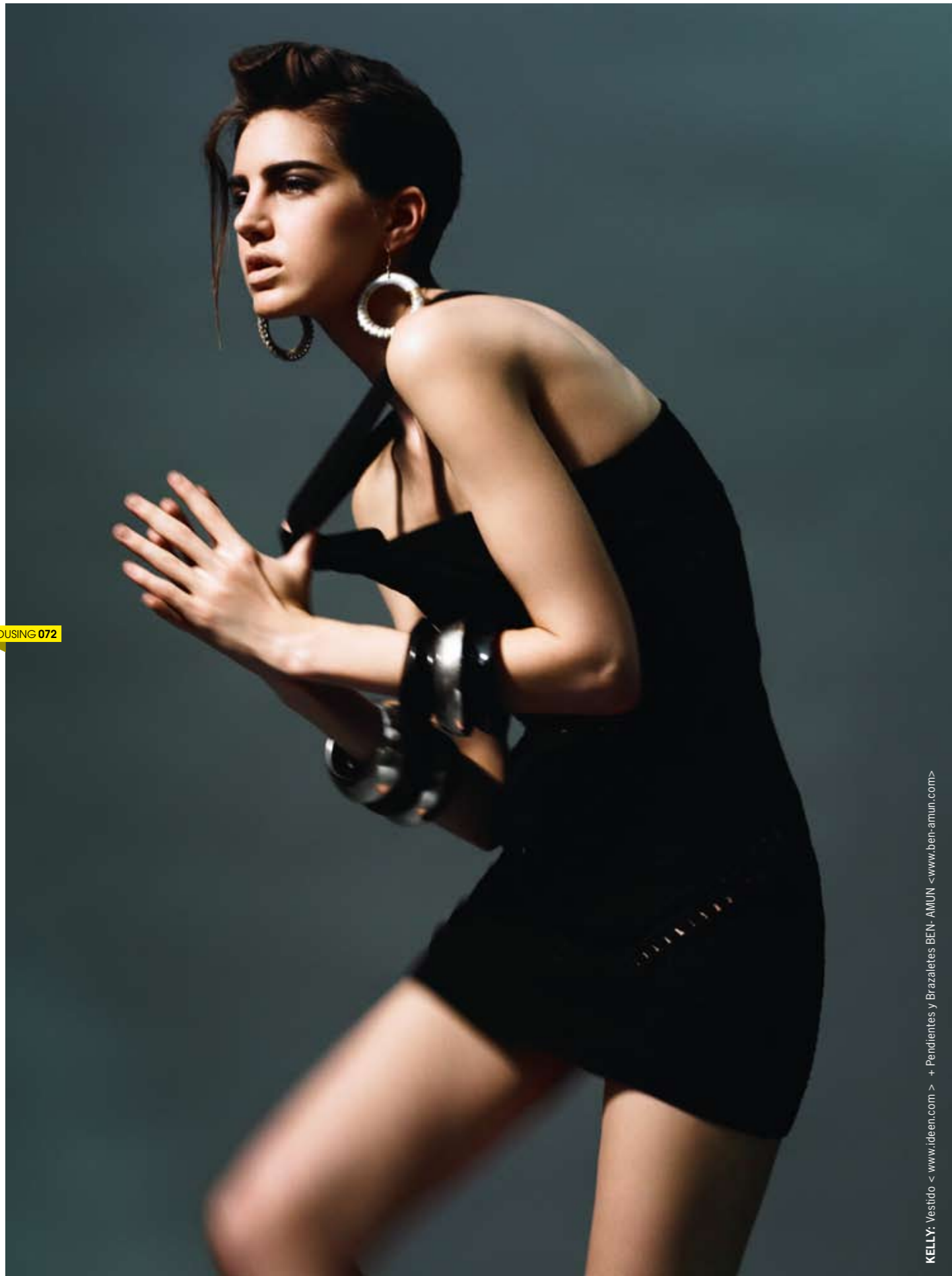
KELLY: Vestido < www.ideen.com > + Pendientes y Brazaletes BEN-AMUN <www.ben-amun.com>