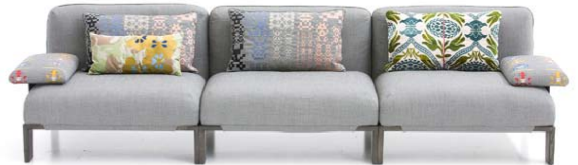
Arriba: MOROSO Sofá Fergana, un diseño de Patricia Urquiola con inspiración en los modelos tradicionales de Uzbekistán. <www.moroso.it>