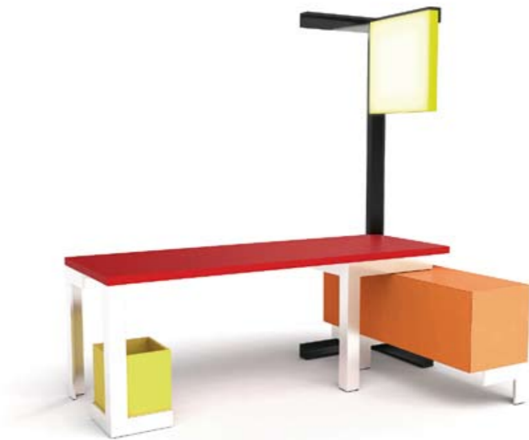
Arriba: ESTABLISHED & SONS Estación de trabajo Open Room No.1 diseñada por Matali Crasset. Tiene de todo, hasta iluminación incorporada <www.establishedandsons.com> Abajo: CAPPELLINI Taburete plegable Stitch, diseño de Adam Goodrum. <www.cappellini.it>