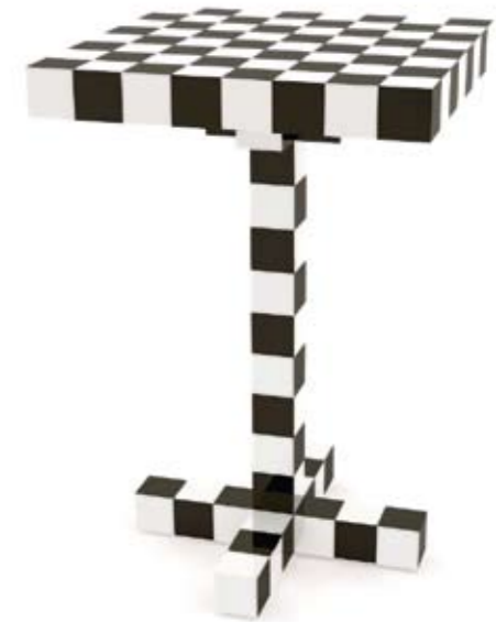
Arriba: MOOOI Mesa Chess, un diseño de mesa auxiliar creado por las suecas Front para jugar al ajedrez <www.mooui.com> Abajo: CAPPELLINI Homage to Mondrian 2, serie de armarios diseñados por Shiro Kuramata en homenaje al pintor abstracto. <www.cappellini.it>