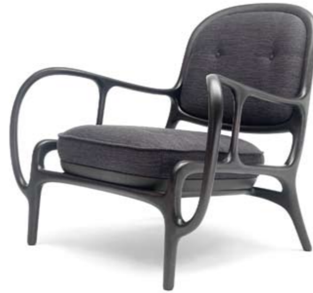
Arriba: CECCOTTI Butaca TwentyTwo, diseño de Jaime Hayon. Está hecha con 22 piezas de madera, de ahí su nombre. <www.ceccotticollezioni.it> Abajo: THONET Taburete alto 404H, diseñado por Stefan Diez. Su asiento está inspirado en una silla de montar. <www.thonet.de>

OLGA: Chaqueta MARTIN GRANT <www.martingrantparis.com> + Collar SUBVERSIVE <www.subversivejewelry.com> + Anillo ALEXIS BITTAR <www.alexisbittar.com>