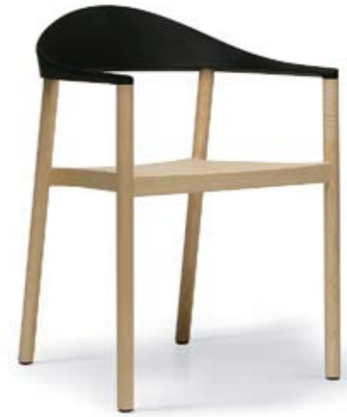
Arriba: PLANK Silla Monza diseñada por Konstantin Grcic, un modelo que combina madera con plástico en su respaldo. <www.plank.it> Abajo: GERVASONI Silla de la colección Sweet, diseño de Paola Navone, de gran respaldo y con el asiento encordado. <www.gervasoni1882.it>