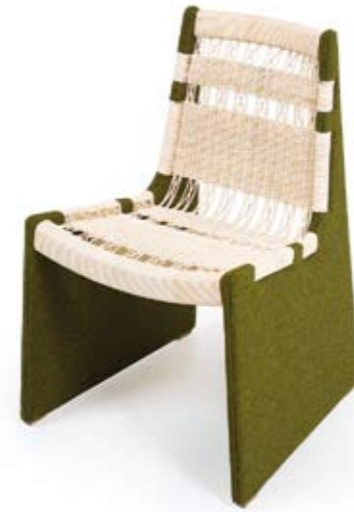
Arriba: DE LA ESPADA Silla Tou diseñada por Leif.designpark, un modelo que combina tapizado de tejido con un respaldo de rattan. <www.delaespada.com> Abajo: GANDIA BLASCO Alfombra Palermo, con un dibujo realizado por la diseñadora gráfica Sandra Figuerola. <www.gandiablasco.com>